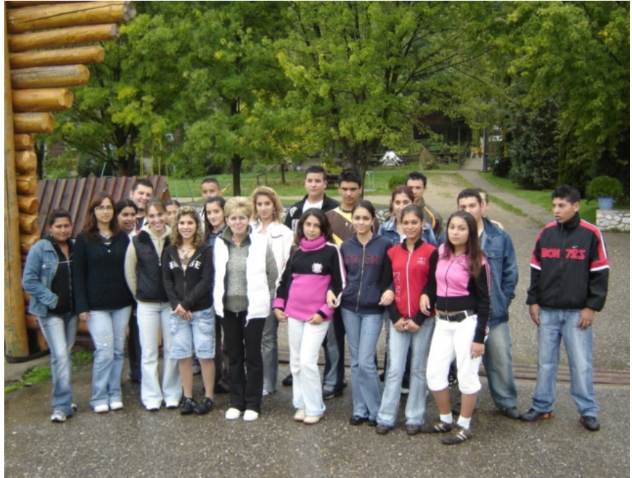
A kerecsendi tanodások Bogácson